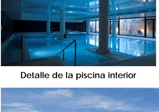
Detalle de la piscina interior

Contratas y Obras ha construido y es socio de referencia del nuevo Hotel Balneario Alhama de Aragón . El centro termal está formado por cinco edificios conexados entre sí, cuatro de ellos rehabilitados en su totalidad y uno de nueva construcción. La zona termal del Hotel cuenta con una piscina cubierta termo lúdica y otra exterior, chorros cervicales, cuellos de cisne, jacuzzis y zona de natación contracorriente, piscina caldarium y saunas, zona de tratamiento específico con inhaladores, duchas vichy y zona de bañeras.