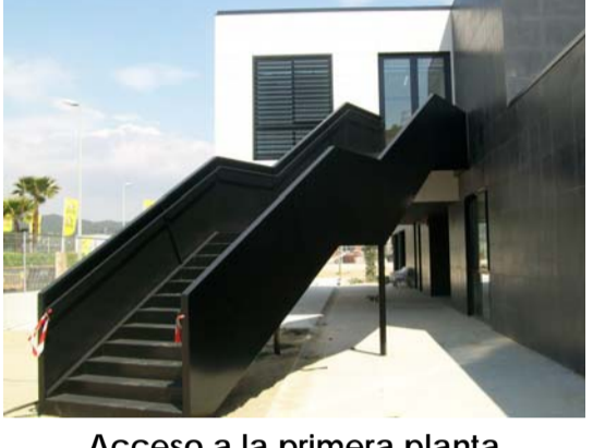
Acceso a la primera planta

La localidad barcelonesa de Cubelles cuenta con un nuevo centro de educación infantil y de primaria (CEIP) construido por Contratas y Obras. Los trabajos se han desarrollado en sólo diez meses gracias al diseño de su fachada que ha permitido optimizar los trabajos y conferir al mismo tiempo un aspecto formal de mayor calidad en contraposición a otros sistemas industrializados .