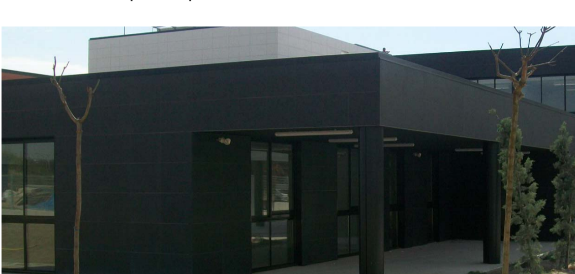
Detalle de la entrada principal del nuevo CEIP de Cubelles