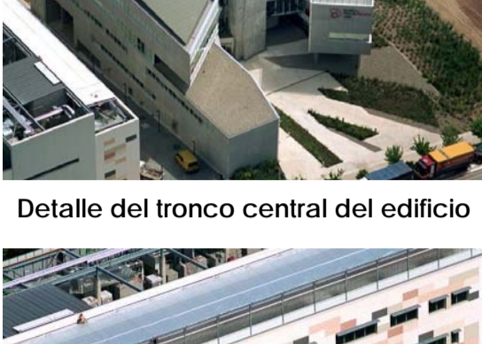
Detalle del tronco central del edificio

Contratas y Obras ha construido un centro de transferencia tecnológica en el Campus de la Universidad de Barcelona , así como todos sus accesos, para el Consorcio de la Zona Franca. El edificio ha sido diseñado por el prestigioso estudio de arquitectura CTSARQ (Cinnamon-Torrenó-Sala Arquitectos) y cuenta con cuatro plantas sobre rasante y una subterránea destinada a aparcamiento. La estructura del edificio ha sido desarrollada bajo las influencias de la arquitectura orgánica gracias a un tronco central diseñado con volumetrías cambiantes sobre el que giran el resto de espacios del centro.