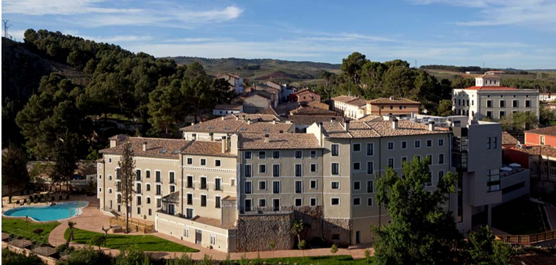
Imagen panorámica del Hotel Balneario Alhama de Aragón