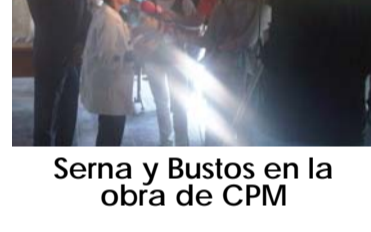
Serna y Bustos en la obra de CPM

CPM, empresa del Grupo CyO , está rehabilitando las oficinas del Servei d'Ocupació de Catalunya en Sabadell. Los trabajos afectan a la planta sótano, baja y altillo según el proyecto redactado por el arquitecto Rafeal Tejada. La adecuación finalizará el próximo mes de enero y ya ha recibido la visita de la consellera de Treball de la Generalitat, Mar Serna , y del alcalde de Sabadell, Manel Bustos .