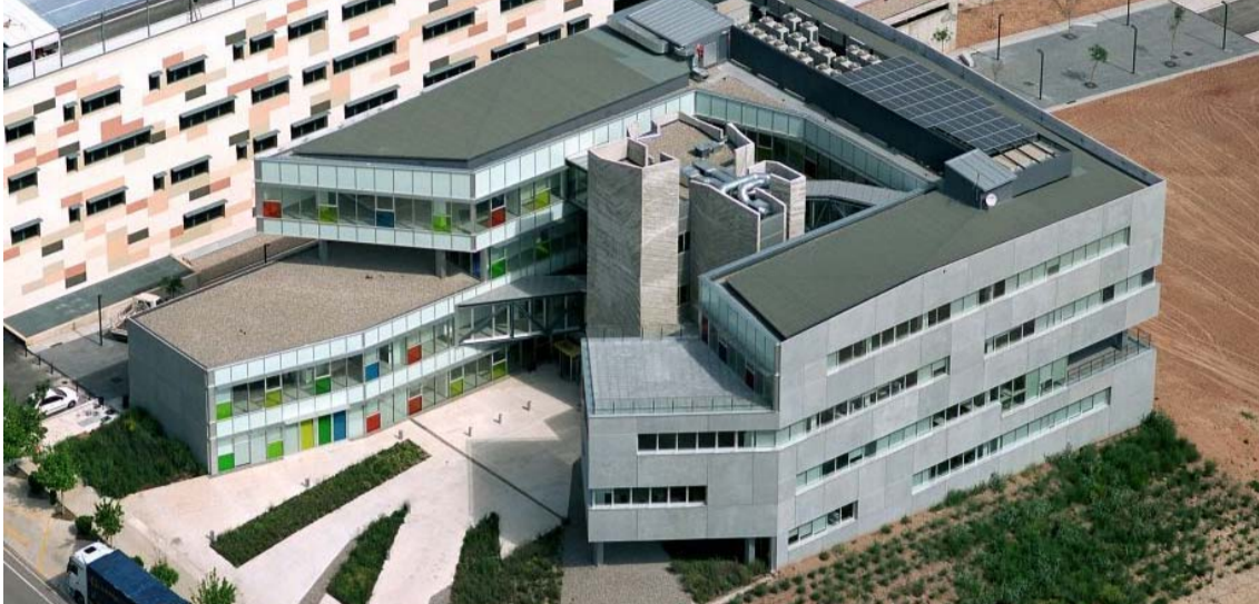
Imagen del centro tecnológico 'Eureka' y de su entorno