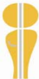
Logo Plan Igualdad de CyO