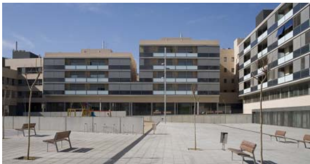
Promoción de viviendas "Sinia del Gall"