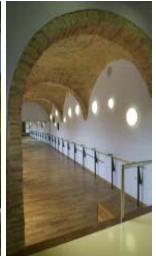
Sala de yoga

entidades del barrio y un taller de pintura.