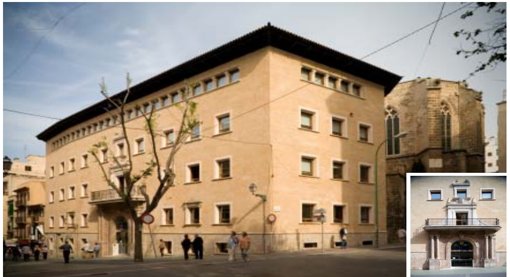
Fachada calle Olmos