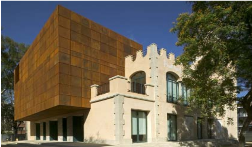
Vistas exterior edificio

El edificio es una construcción situada en el medio del jardín delimitado por las calles Muntaner, Bisbe Sivilla, St. Gervasi de Cassoles i Reus. La rehabilitación del edificio es total (1.574,34m 2 , en un plazo de 12 meses), dada la degradación del mismo. Dicho edificio consta de planta baja más dos superiores. Estilísticamente se trata de un edificio de principios del pasado siglo, con estilo modernista.