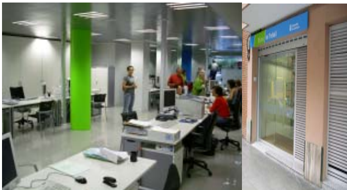
Vistas interior y exterior oficina

Local ubicado en la planta baja de un edificio del centro urbano de Gavà. La reforma integral del local ha consistido en la renovación global y nueva distribución de los diferentes espacios y despachos, incluyendo la adecuación de las instalaciones existentes a las necesidades del nuevo usuario y a la normativa vigente en la actualidad. Las nuevas particiones se han realizado siguiendo criterios de transparencia entre espacios.