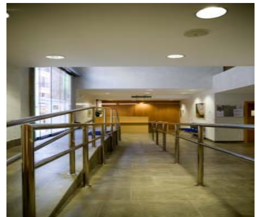
Rampa Acceso Vestíbulo